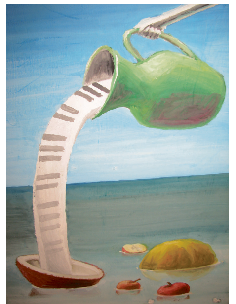
2011. gada absolventa Normunda Ozola darbs Mākslas dienu izstādē

Dziesmu un Deju svētki un viss garais gatavošanās posms. Mums skatē bija jādejo ļoti grūta deja – «Vilks un kaza» – likās, mēs to nespēsim paveikt. Un vēl copīšu pišana. Bet skolotāja bija sagādājusi katrai pa «frizieri», un uz dejas sākumu bijām gatavas. Nodejojām lieliski! Iekļuvām TOP 10 starp C grupas dejotājiem. Un braucām uz svētkiem!