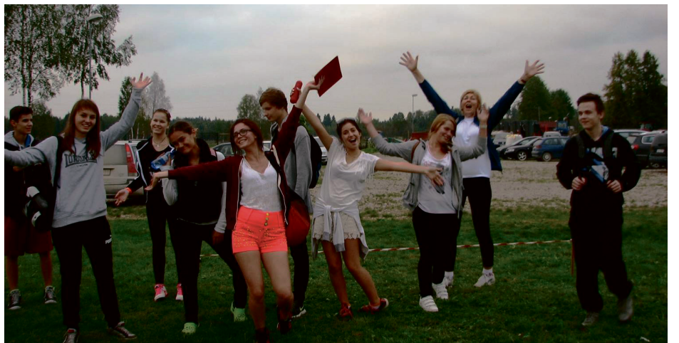
2014. gada Lielgājiens uz «Juku dzirnavām»