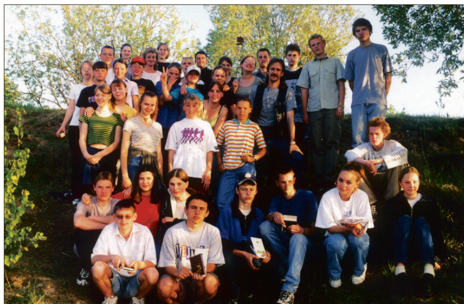
1999. gada Erudītu konkursa uzvarētāji ekskursijā Igaunijā

Maija mēnesī dažreiz erudītu kustības nodarbības bija laukā pie ugunsкура. Patiesībā Talantu skolas ģeogrāfijas grupiņā erudītu konkursu uzdevumi top katru mē-