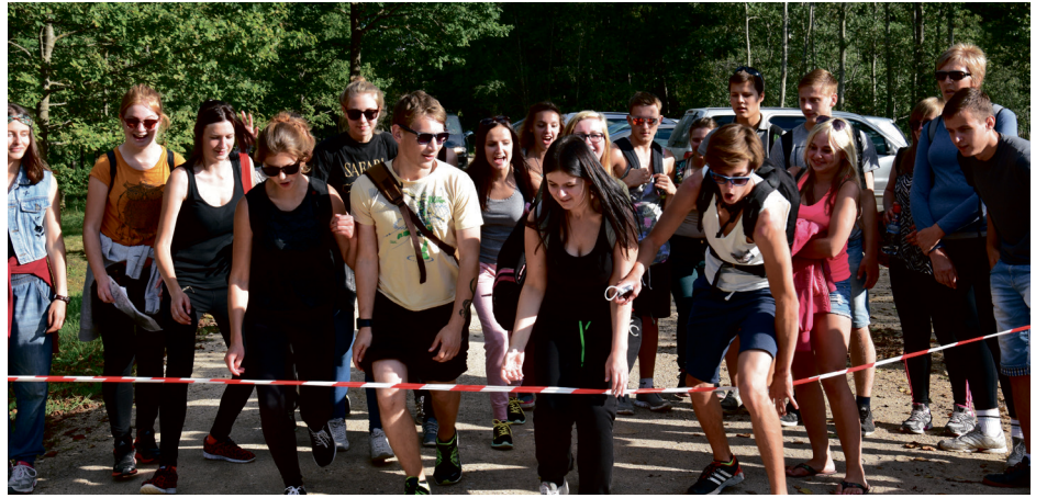
2015. gada Lielgājiens, 12. klase finiša taisnē «Zvejniekos»

Lielgājiens ir pasākums, kuru nevar un negribas aizmirst. Lielgājiens – lielpārbau-dījums!